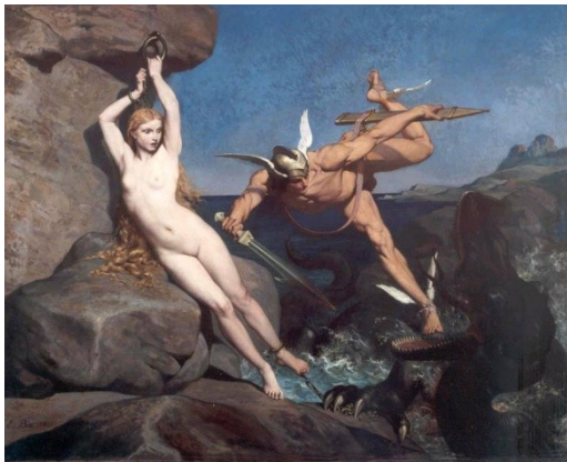
Andromède Emile BIN 1865