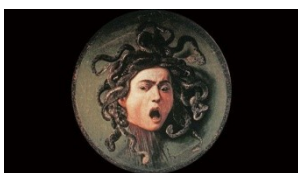
Caravage tête de la Méduse

Andromède est attachée nue, non au rocher, mais au ciel, car sa condamnation est d'ordre divin.