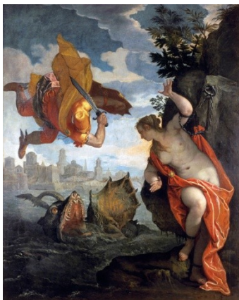
Andromède Véronèse 1577