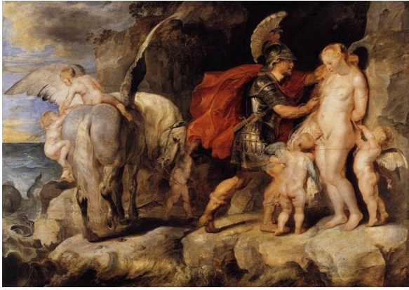
Andromède et Persée Peter Paul Rubens 1622