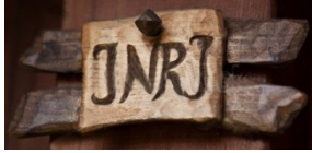
Jésus le nazaréen roi des juifs cosmogonie