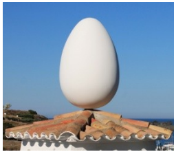
maison de Dali