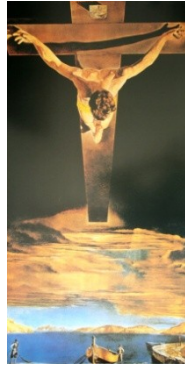
le christ Dali