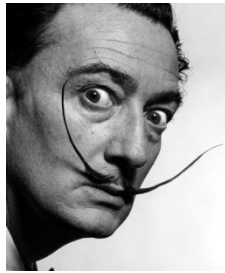
moustaches de Dali