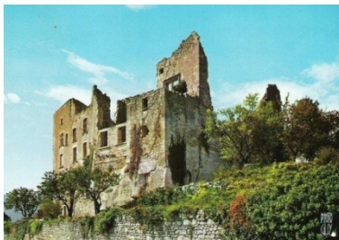
Château de Sade

La bouteille de vin est un Châteauneuf du pape qui fait référence au pape donc à la religion, celle-ci a toujours eu des problèmes avec le sexe. Le château représenté sur l'étiquette est celui du marquis de Sade (domaine Lacoste), il est en ruine en opposition avec celui du pape qui est neuf.