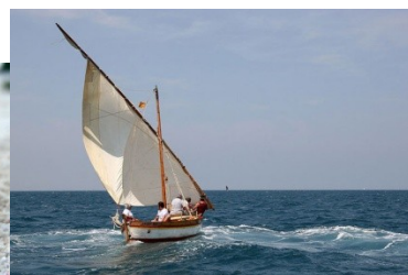
L'invention collective René Magritte bernard-l'ermite barque catalane