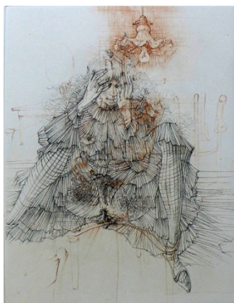
Hans Bellmer Les infortunes de la vertu (Sade)