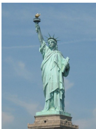
A. Bartholdi La liberté