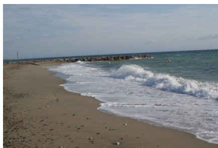
Plage de la Lagune St Cyprien 66