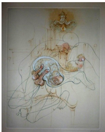
Hans Bellmer Les crimes de l'amour (Sade)

L'encre devient la matière de l'image et celle des mots. La Catalogne est le pays de Dali, surréaliste notoire, dont ce tableau se réfère dans la démarche créatrice où l'inconscient est omniprésent, car chaque signifiant peut renvoyer à une multitude de signifiés.