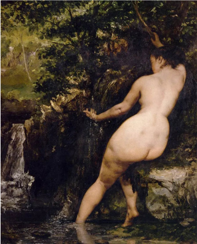
Gustave Courbet La Source