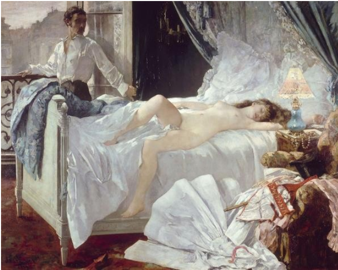
Rolla 1878 Henri Gervex