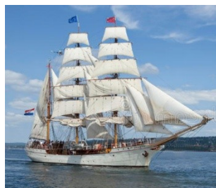
Trois mats Europa