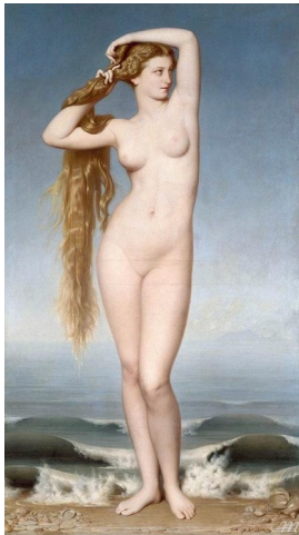
AMAURY DUVAL Vénus