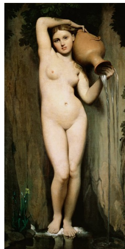
Jean Auguste INGRES La source