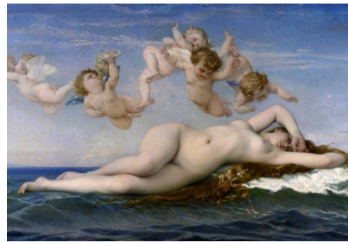
Alexandre CABANEL Vénus