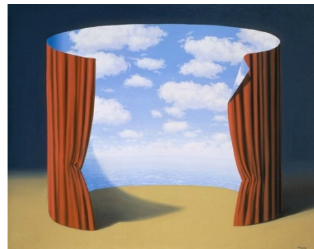
René MAGRITTE ciel théâtral