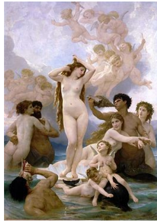
William BOUGUEREAU Vénus