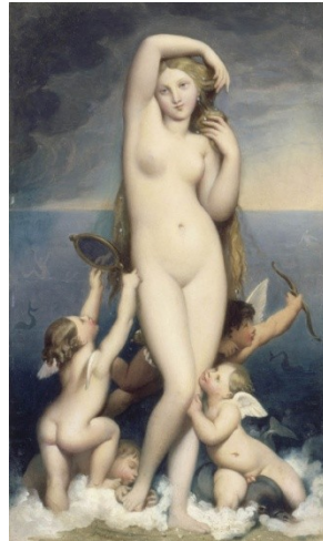
Jean Auguste INGRES Vénus