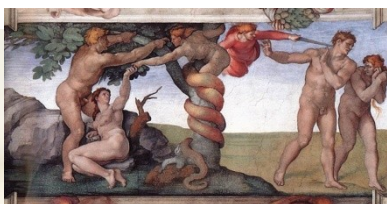
Michel Ange-Adam et Eve