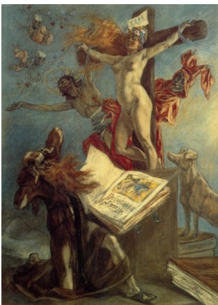
La tentation de st Antoine de Rops 1878

Dans ce dessin se trouve une deuxième représentation de st Antoine issue d'un tableau de Dali, associé à la mort avec le crâne. La femme nue est encore l'objet de la tentation, avec le diable derrière la croix et un christ sexué et omniprésent, son pagne s'envolant dans le ciel. Les cochons désignent toujours l'instinct sexuel. La bible est toujours présente avec Joseph.