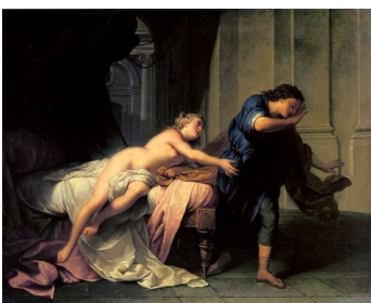
Joseph et Mme Putiphar de Nattier 1711