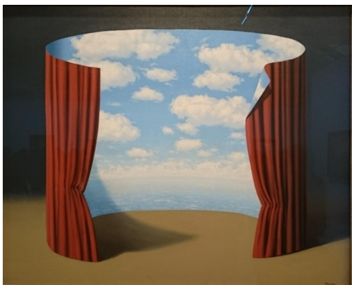
René Magritte ciel théâtral