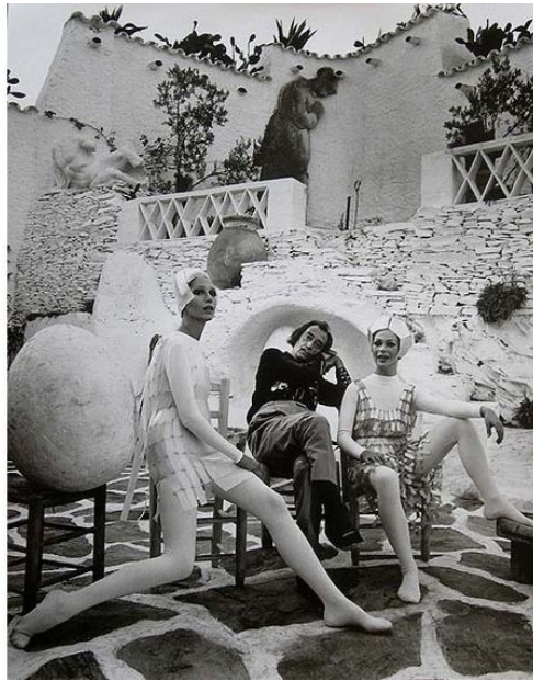
Salvador Dali avec les robes de Paco Rabanne