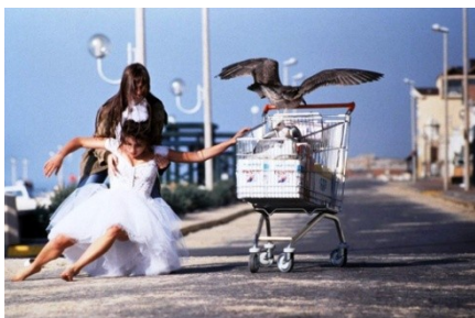
Merci la vie Blier

Le cinquième signifiant est l'ensemble des personnages nus sur la plage et qui réagissent en redondance de la nudité du sujet principal.