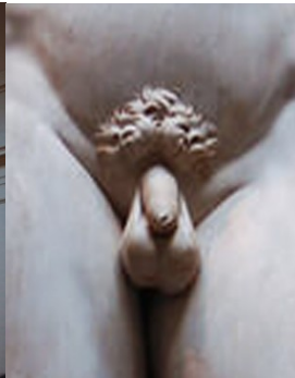
pénis de David