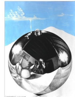
Cosmogonie II 1985