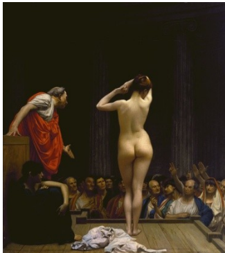
Marché romain aux esclaves 1884 Jean-Léon GEROME

Dans le tableau la femme nue est aussi objet de désirs sexuels, mais libre, elle sort de l'espace clos par une baie vitrée pour une perspective marine ensoleillée, associée aux vapeurs du vin blanc qui est un bourgogne aligoté dont le nom est tout un programme sensuel bien ficelé