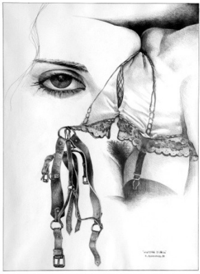
Histoire d'œil 1981