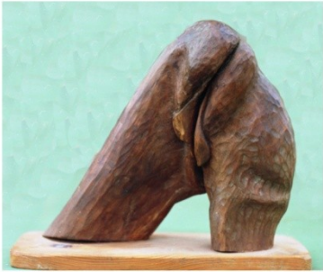
Le tilleul enchanté 1989