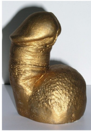
La chose 1996