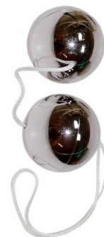
boules de geisha