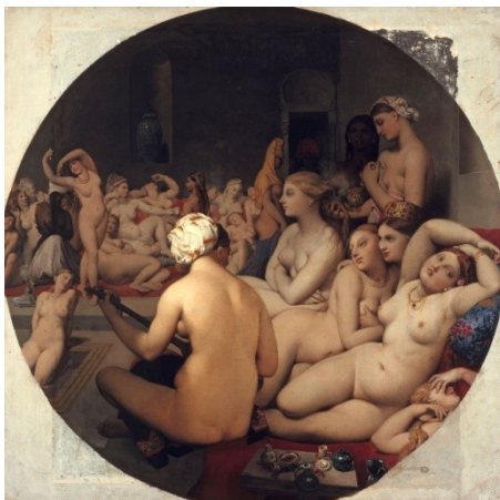
Ingres Le bain turc 1862

Le dessin dont un des coins s'enroule, signifie qu'il s'agit seulement d'un dessin, loin de la réalité, l'expression d'une idée.