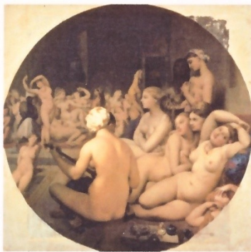
Ingres Le bain turc 1862

Les deux boules sont en fait des boules de geisha qui permettent à la femme de prendre du plaisir intime sans homme, comme dans le bain turc du tableau et deviennent des violons d'Ingres.