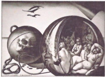
2017 « Violon d'Ingres » crayon sur papier 28,5x39cm