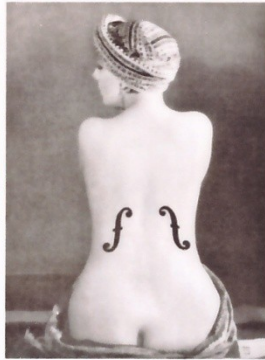
Man Ray Le violon d'Ingres 1924